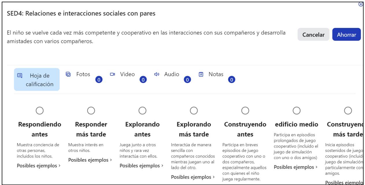
Figura 2.5-1: Visualización de niveles de desarrollo y descriptores