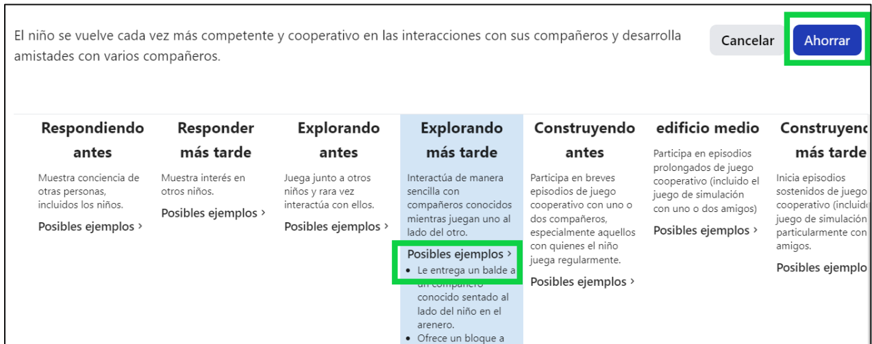
Figura 2.5-2: Ver los posibles ejemplos